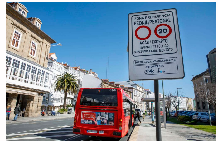
ZONA PEATONAL | ZBE