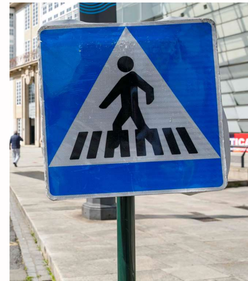
Proyecto cofinanciado fondos Next Generation | Inversión: 280.000 euros