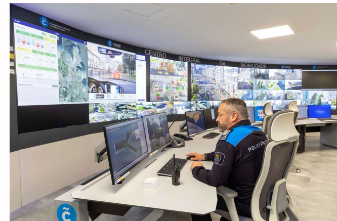
SALA PANTALLAS | CiMOB